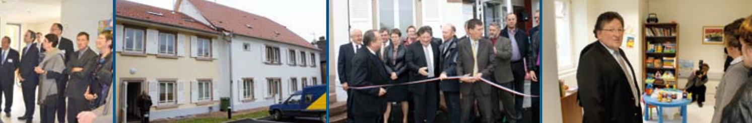
Inauguration de la Maison de Services de Saâles