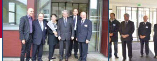
Inauguration de la Clinique St Luc de Schirmeck