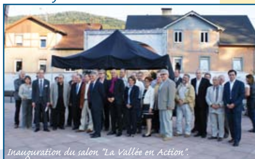
Inauguration du salon "La Vallée en Action".